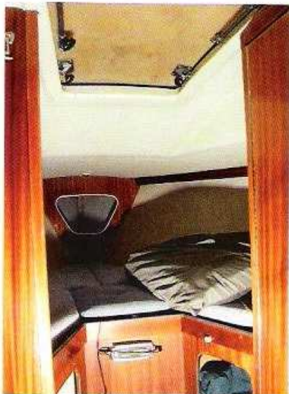
Förpiken har ett djupt insteg som ger gott om luft och svängrum.