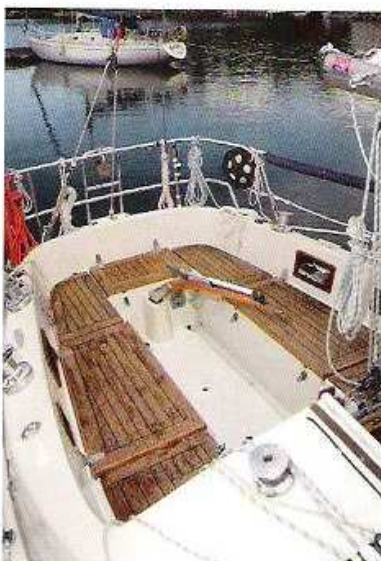
Sittbrunnen är lång och har höga sargkanter.